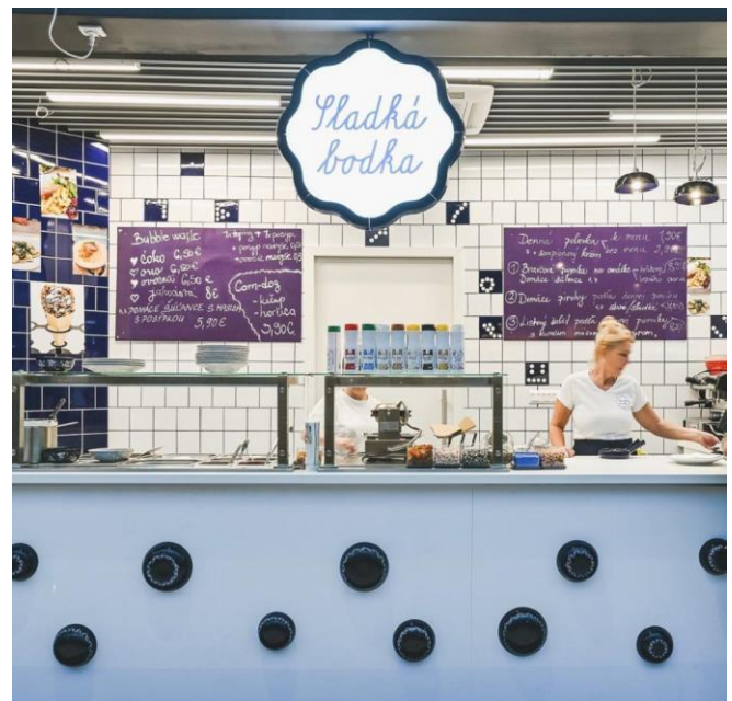
Obr. 1 Zariadenie Sladká bodka Nivy Bratislava